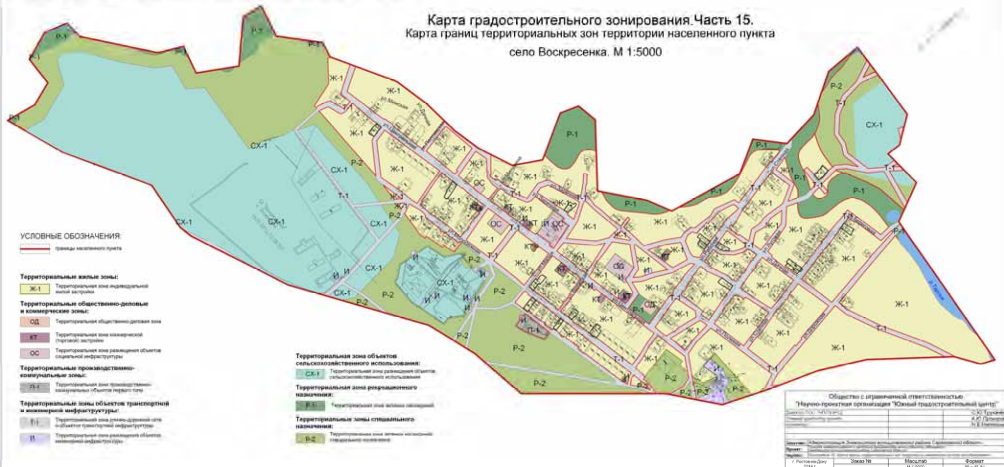
Карта градостроительного зонирования. Часть 15. Карта границ территориальных зон территории населенного пункта село Воскресенка. М 1:5000